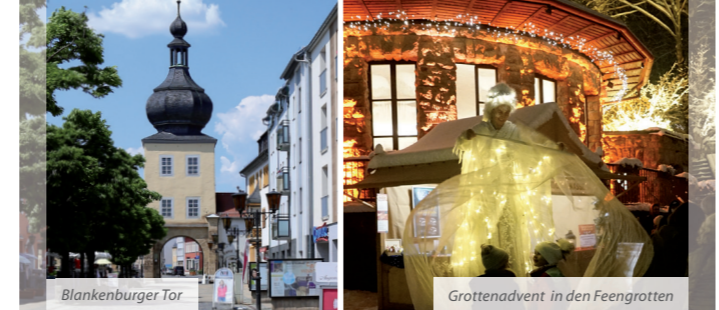
Blankenburger Tor | Grottoadvent in den Feengrotten