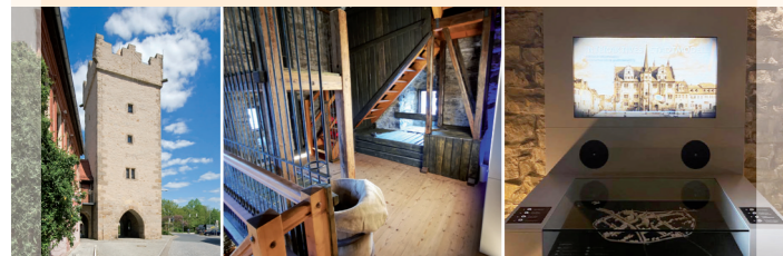
Darrtor – Alles, was recht ist · Darrtorstraße Schurken, Henker und Scharfrichter