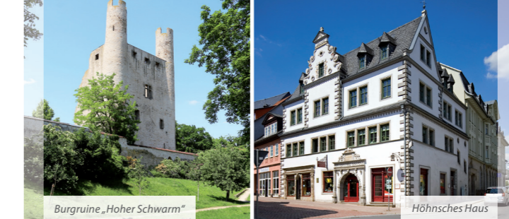
Burgruine „Hoher Schwarm“ | Höhsches Haus