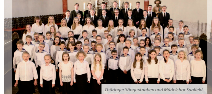
Thüringer Sängerknaben und Mädelchor Saalfeld

Altstadt- führung bis 26.10. jeden Samstag 11 Uhr