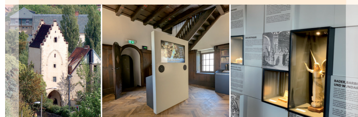
Saaltor – Gegen alles ist ein Kraut gewachsen · Saalstraße Kräuterfrauen, Apotheker und Heiler