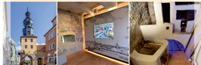
Oberes Tor – Nie ohne Risiko unterwegs · Obere Straße Kaufleute, Torwächter und Händler

Folgen Sie dem Nürnberger Kaufmann und seinem Gefolge entlang der alten Handelsstraße und begleiten Sie ihn bei seinem ereignisreichen Aufenthalt in Saalfeld im Jahr 1610.