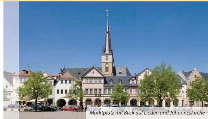
Marktplatz mit Blick auf Lieden und Johanneskirche